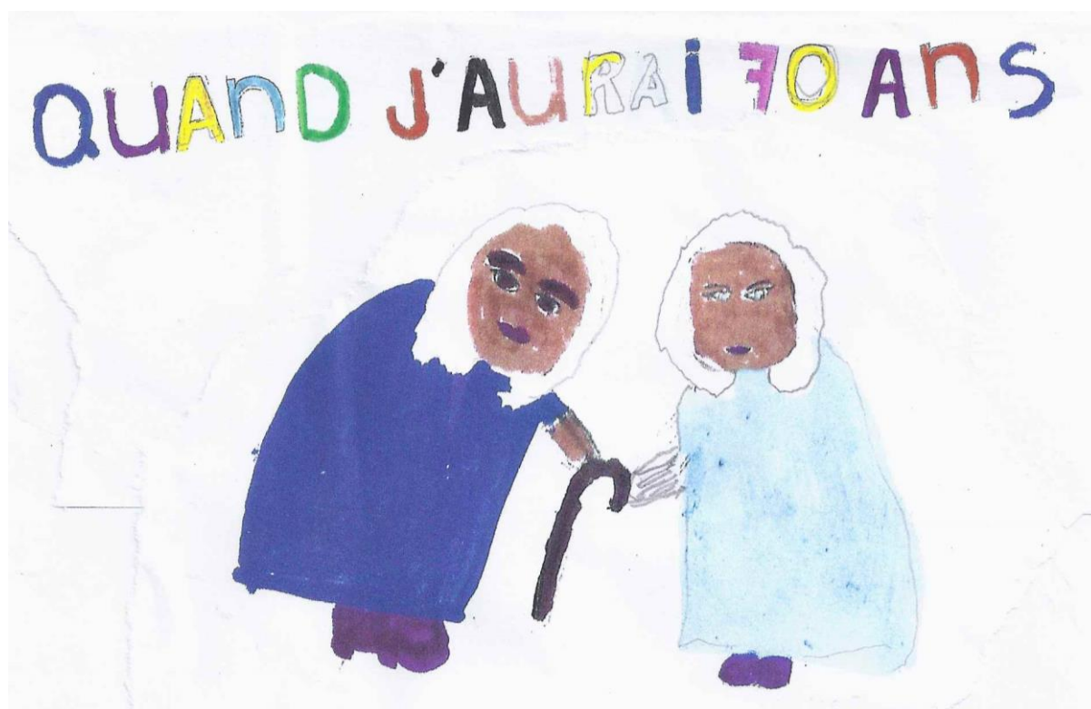
Dessin de Maya, 8 ans, APEMS Bois Gentil Lausanne

L'AVIVO fête ses 70 ans et des enfants se sont amusés à s'imaginer à cet âge. Le résultat est joyeux, souriant et coloré. De quoi être rassurés par l'image de la vieillesse qu'ont les enfants. Aujourd'hui, le label du « bien vieillir » est devenu incontournable : publicités, cosmétiques, pratiques de soins, diététique, conseils de santé, normes de nutrition et, sur le thème de la golden économie, les banques s'en mêlent aussi. La notion du « bien vieillir » est devenue un label incontournable, au point que l'on finit par se demander si l'on n'a le droit de vieillir qu'à la condition de « vieillir jeune » !